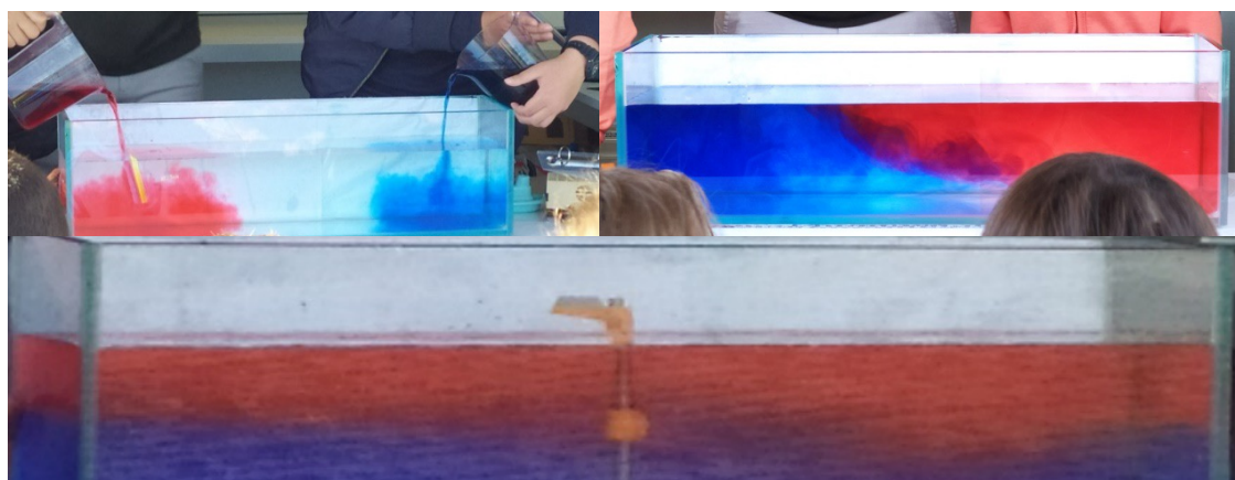
Eau froide, en bleu - Eau chaude en rouge - Mise en évidence de la stratification d'eaux de densités différentes

Les courants profonds dépendent de plusieurs paramètres physico-chimiques comme notamment : la salinité, la température, l'acidité (liée à l'absorption du CO 2 atmosphérique) et la densité (qui dépend de la salinité, de la température et de la pression). Par exemple, des eaux de densités différentes ne se mélangent pas sans courant.