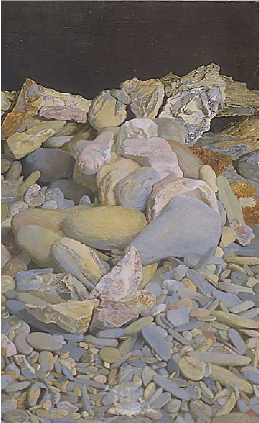
Antoni PITXOT (pintor español), Playa Dormida , 1974

Document d'origine en couleur (tonalités de gris, de beige et de rose pâle).