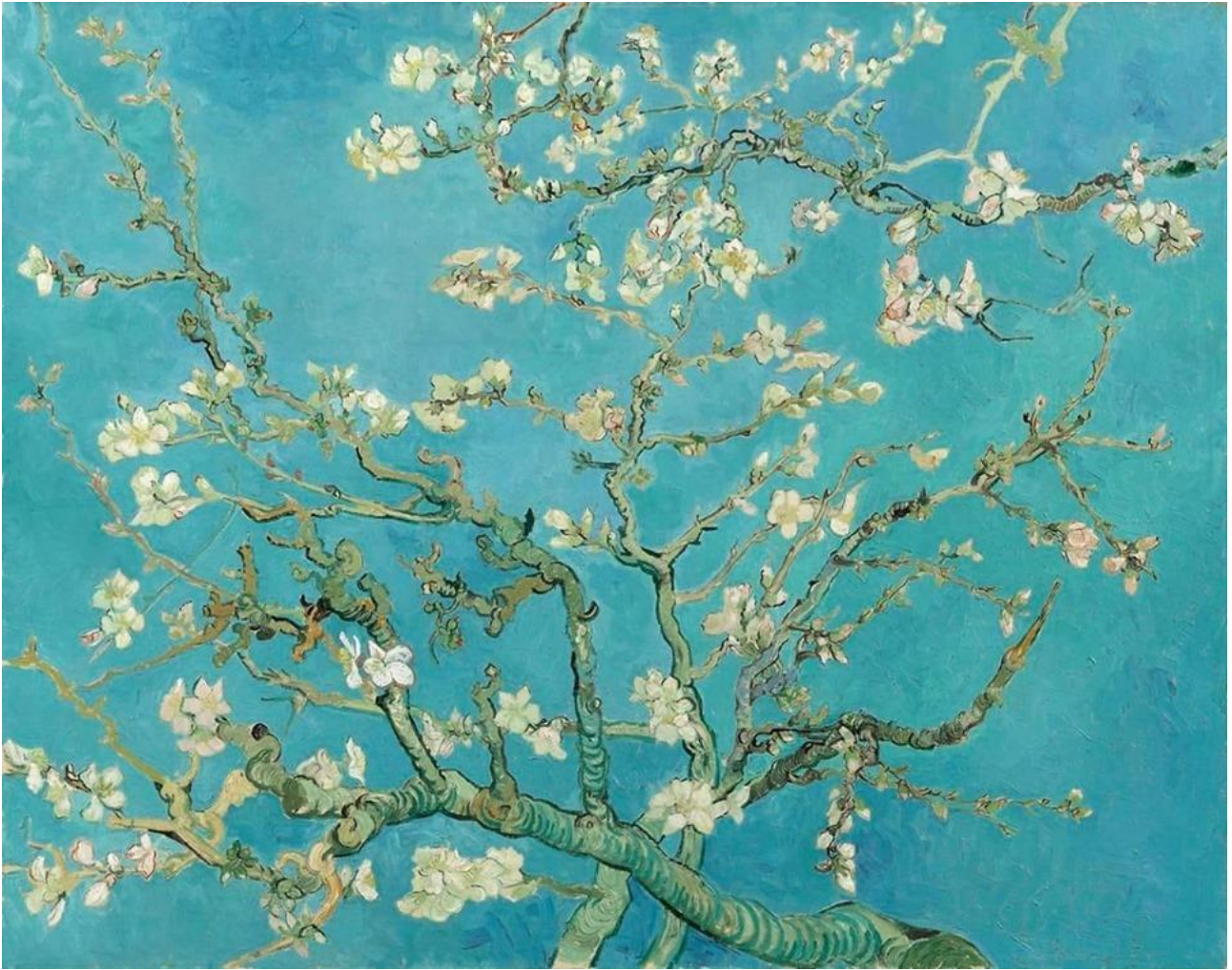
Vincent VAN GOGH, Amandier en fleurs , 1890, huile sur toile, 73,5 x 92 cm. Musée Van Gogh, Amsterdam (Fondation Vincent Van Gogh), Pays-Bas.