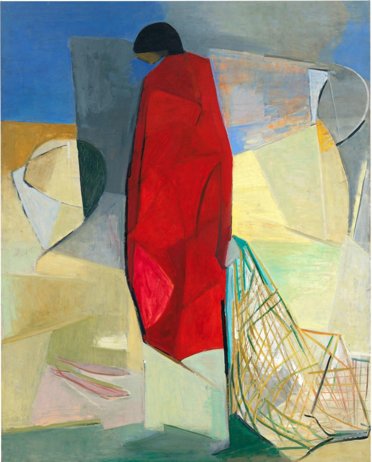
Joan MITCHELL, Untitled (Sans titre) , vers 1949, huile sur toile, 160,6 x 128,9 cm. Joan Mitchell Foundation, New York, États-Unis.