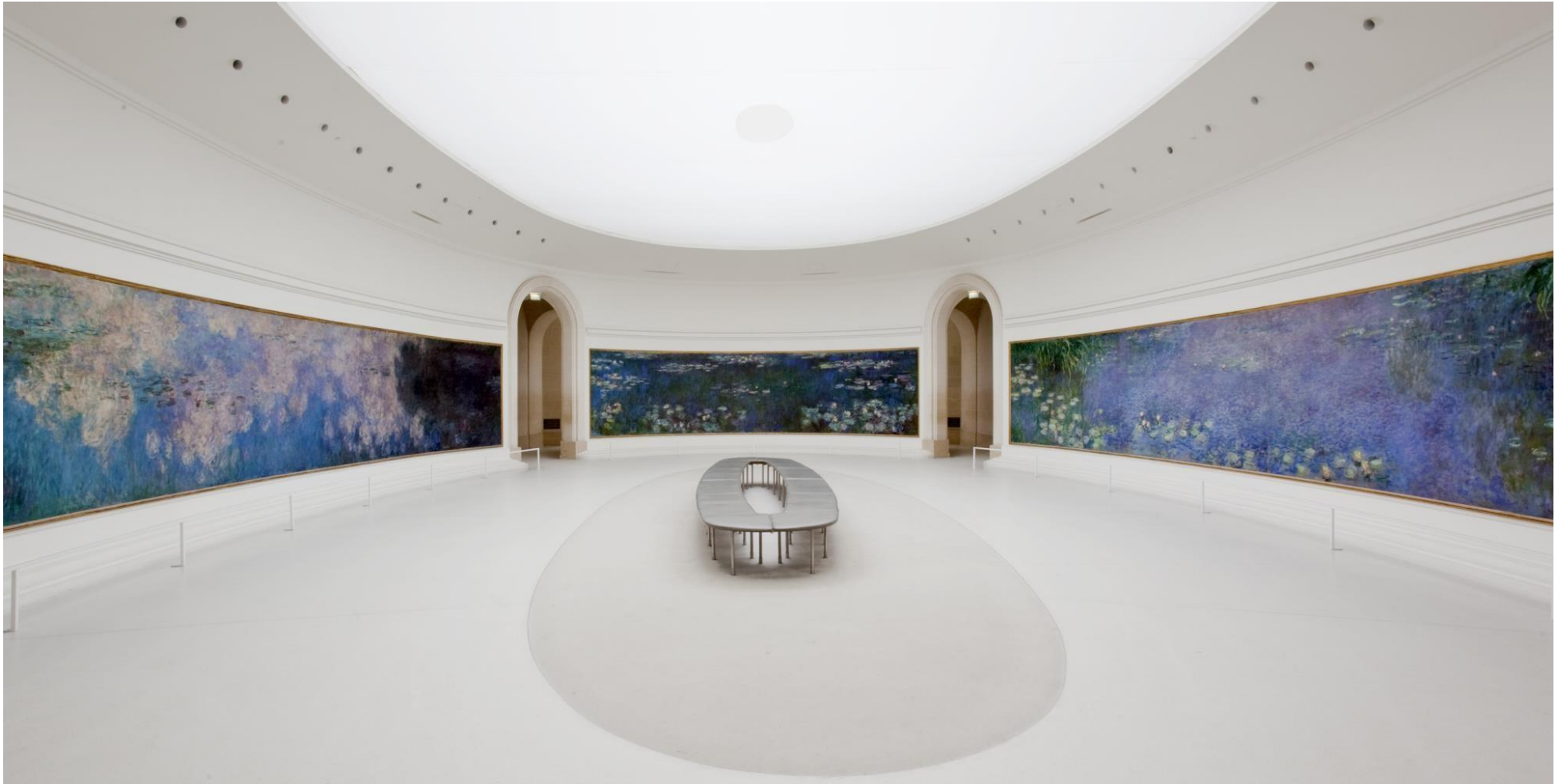
Claude MONET, Cycle des Nymphéas du musée de l'Orangerie , entre 1897 et 1926, huile sur toile, H. : 1,97 m, L. : environ 100 m linéaires, surface environ 200 m 2 . Musée de l'Orangerie, Paris, France.