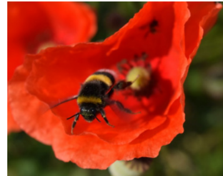
Dispersion par un insecte

Les grains de pollen présentent des tailles, des formes, des ornementsations, (...) qui statistiquement sont caractéristiques du mode de pollinisation.