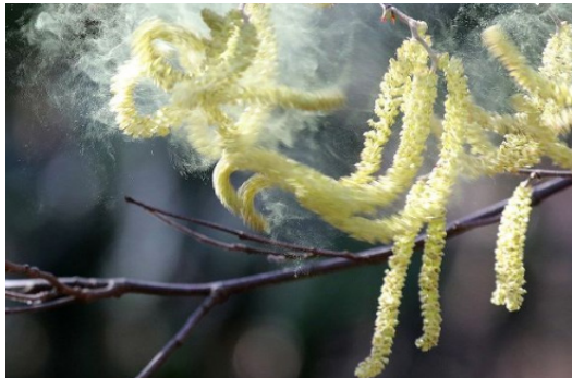
Dispersion des grains de pollen

On cherche à déterminer, par des observations et par des mesures, le mode de pollinisation le plus probable pour la plante proposée.