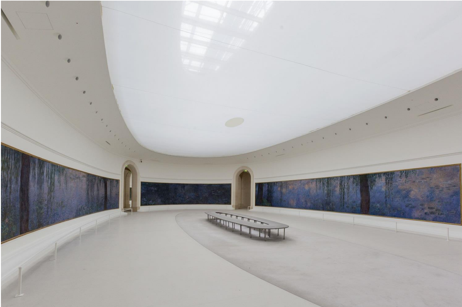
Claude MONET, Cycle des Nymphéas du musée de l'Orangerie , entre 1897 et 1926, huile sur toile, H : 1,97 m, L : environ 100 m linéaires, surface environ 200 m 2 . Musée de l'Orangerie, Paris, France.