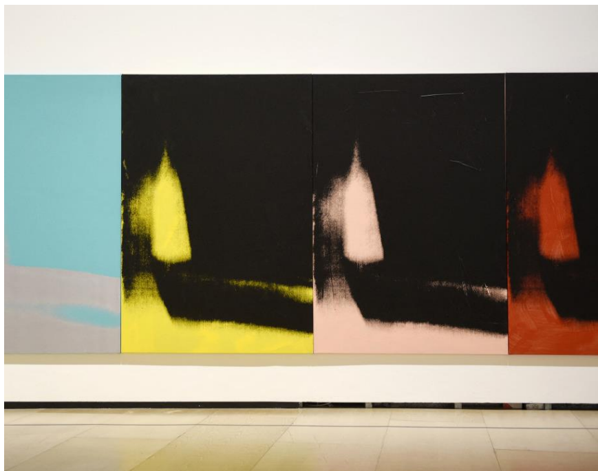
Andy WARHOL, Shadows (Ombres) , 1978-1979, acrylique sur toile, 102 peintures sur toile (sans cadre), L : 193 cm x l : 132 cm x épaisseur : 2,9 cm (chacune). Dia Art Foundation, Beacon, États-Unis.