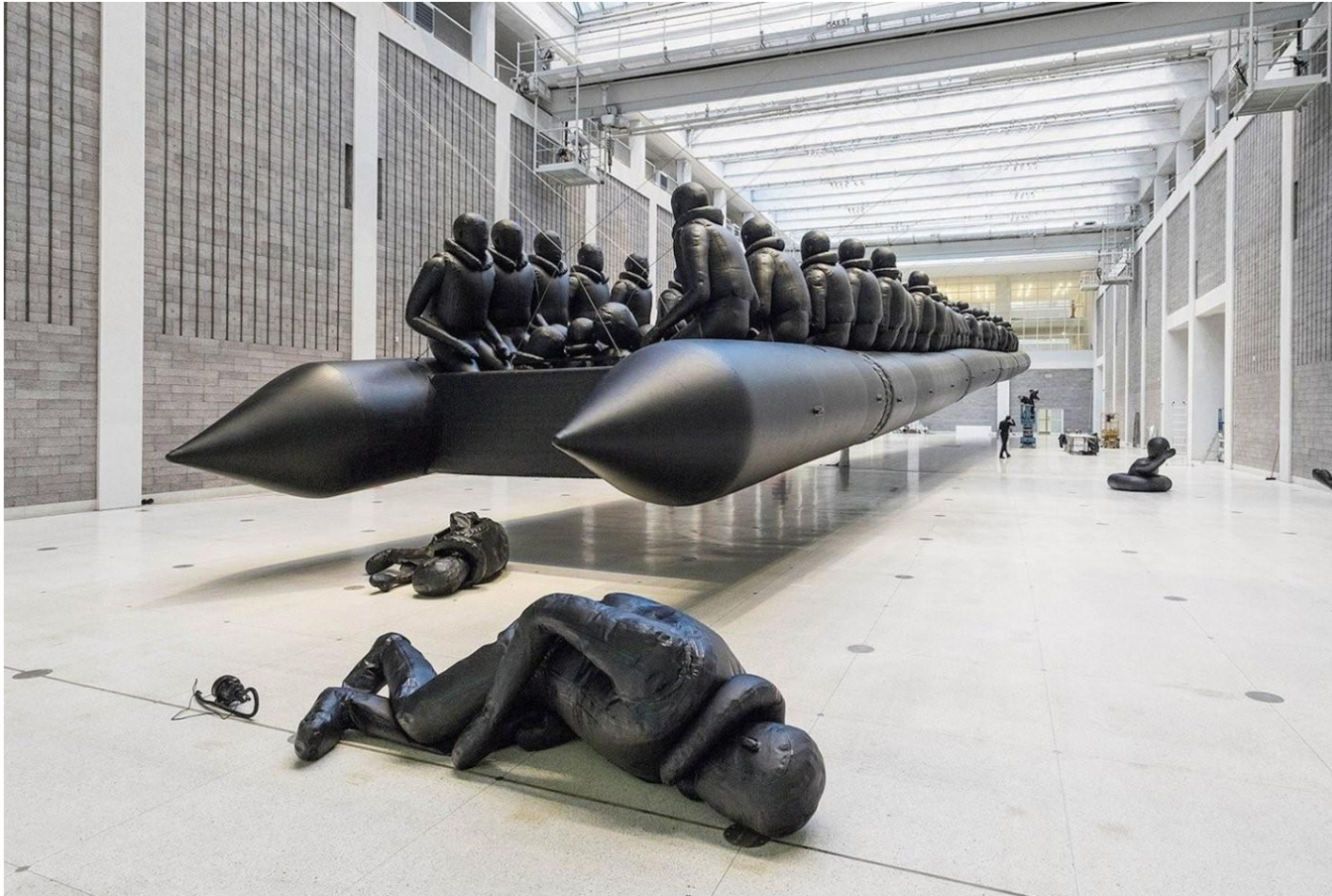
AI WEIWEI, Law of the Journey (La loi du voyage) , 2017, bateau gonflable, 300 figures à échelle 1, caoutchouc noir, suspension d'environ 17 m de long, vue d'exposition, Národní galerie Praha (Galerie Nationale de Prague), Prague, République tchèque.