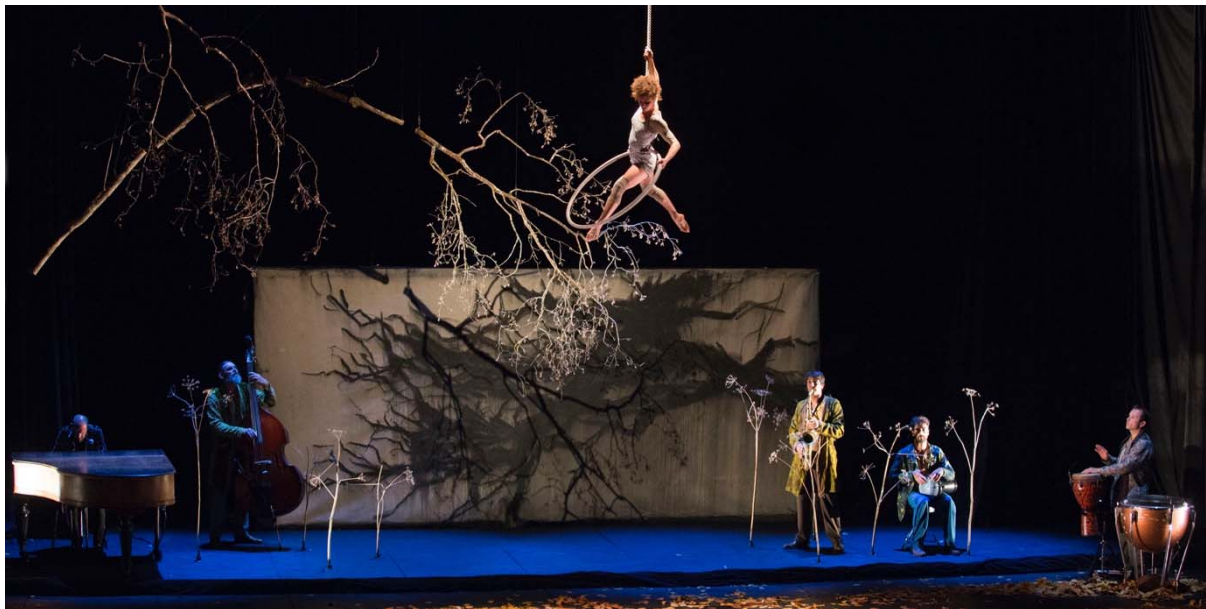
Photographie du spectacle « La dernière saison », cirque Plume, 2018, ( https://www.cirqueplume.com/a-propos-du-spectacle.html )