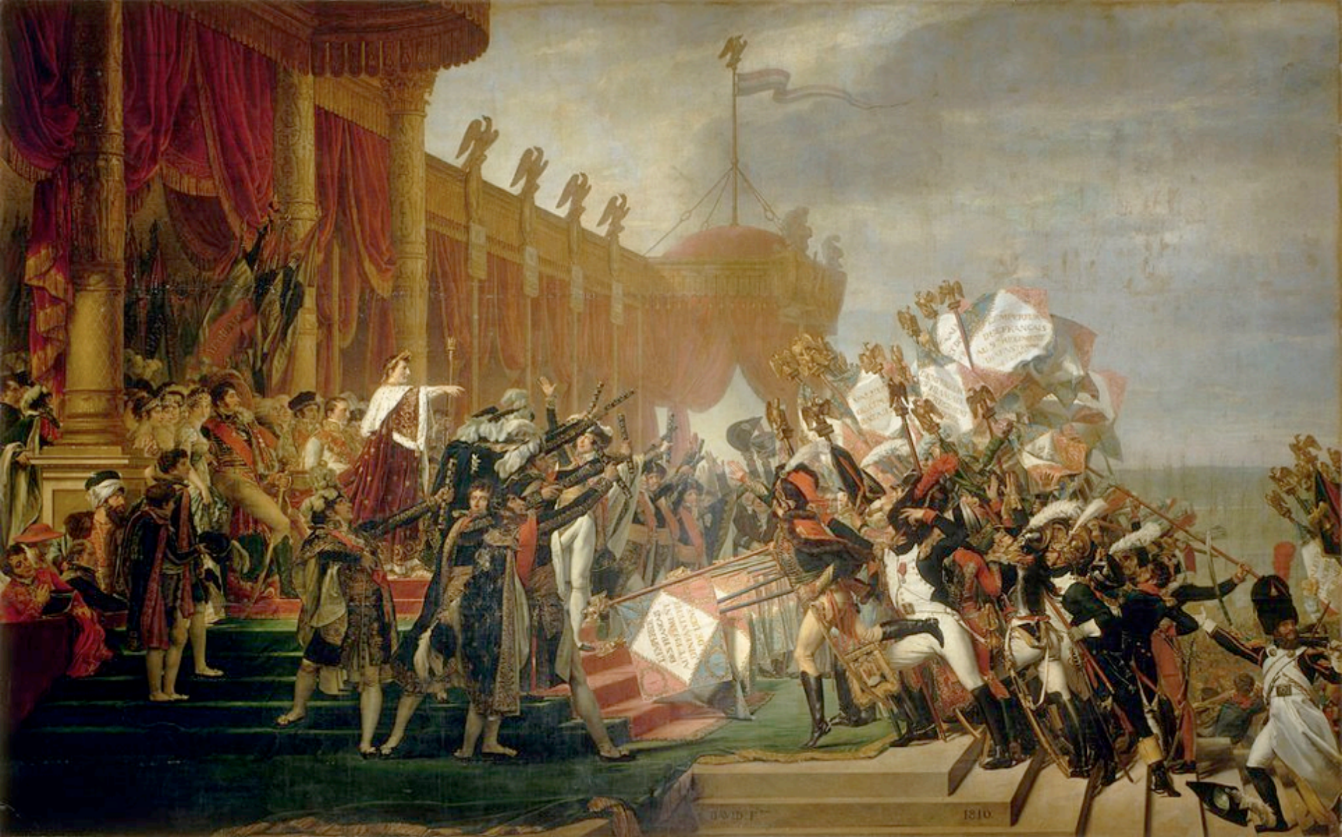
Jacques Louis David - Serment de l'armée fait à l'Empereur après la distribution des aigles, 5 décembre 1804