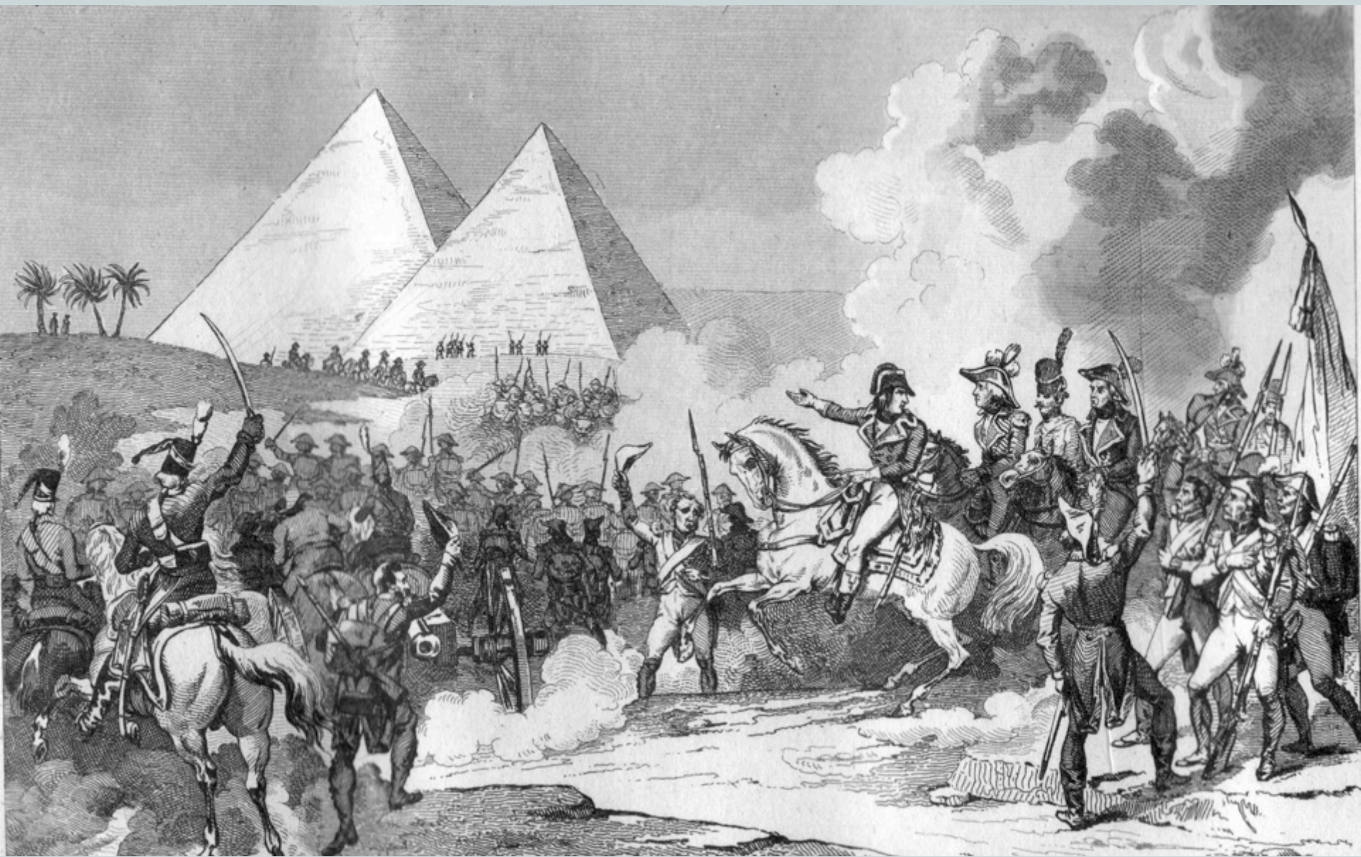
La campagne d'Egypte, 1798