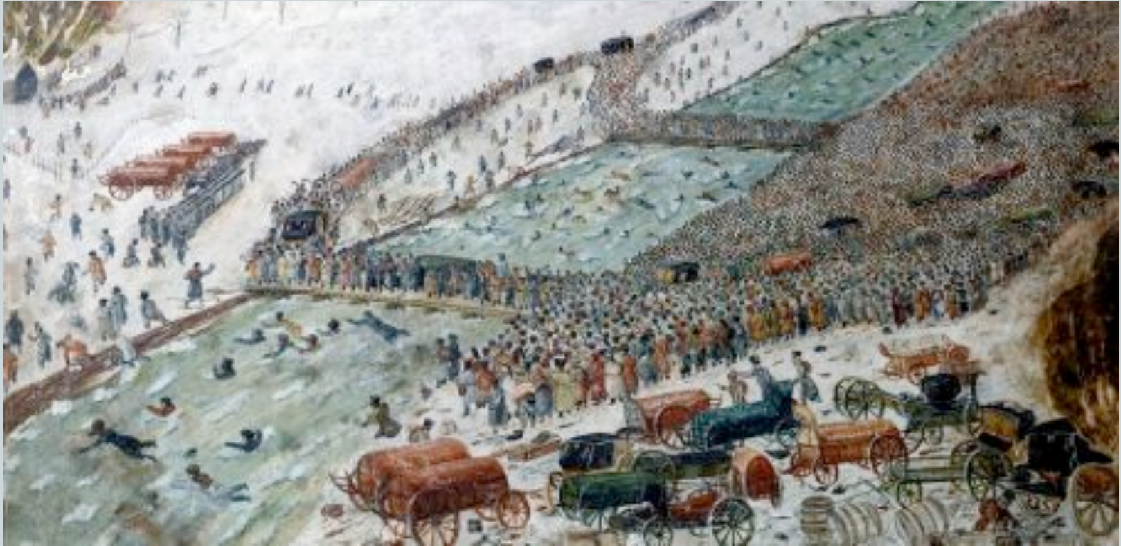
Passage de la Bérézina le 28 novembre 1812. Aquarelle attribuée à François Fournier-Sarloveze