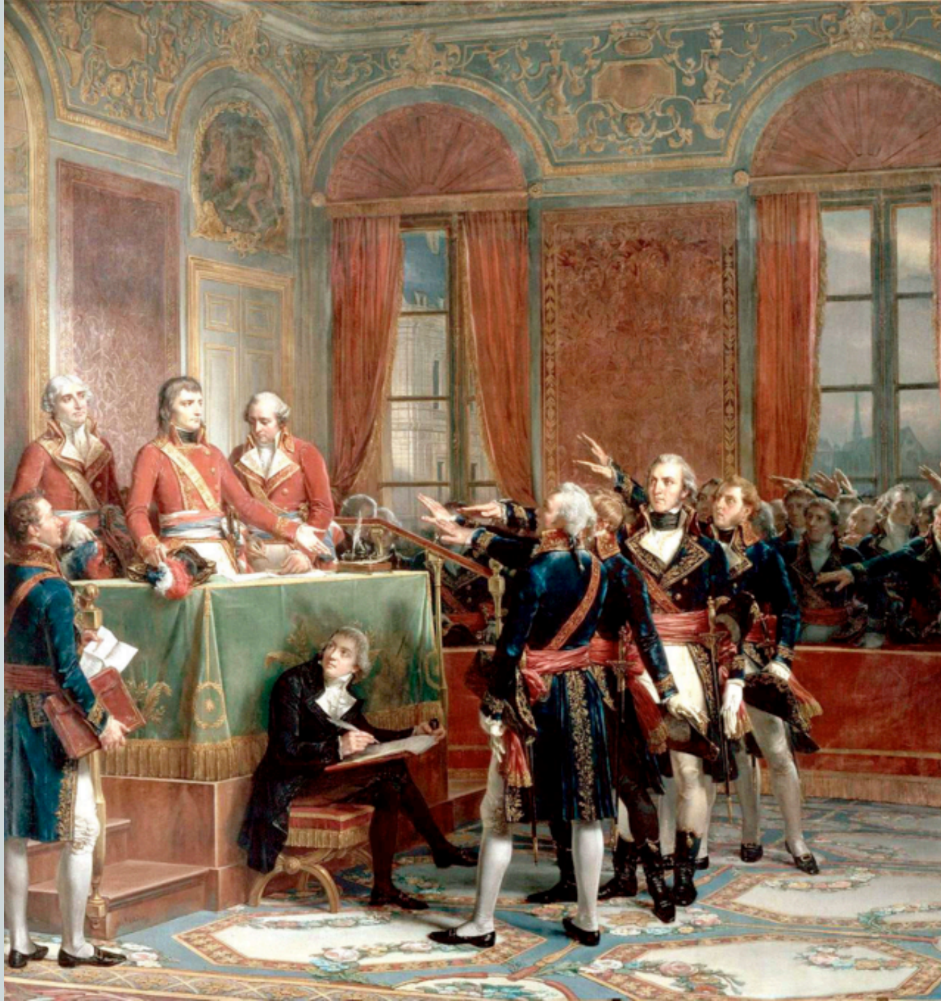
Les trois consuls : Cambacérès, Bonaparte, Lebrun