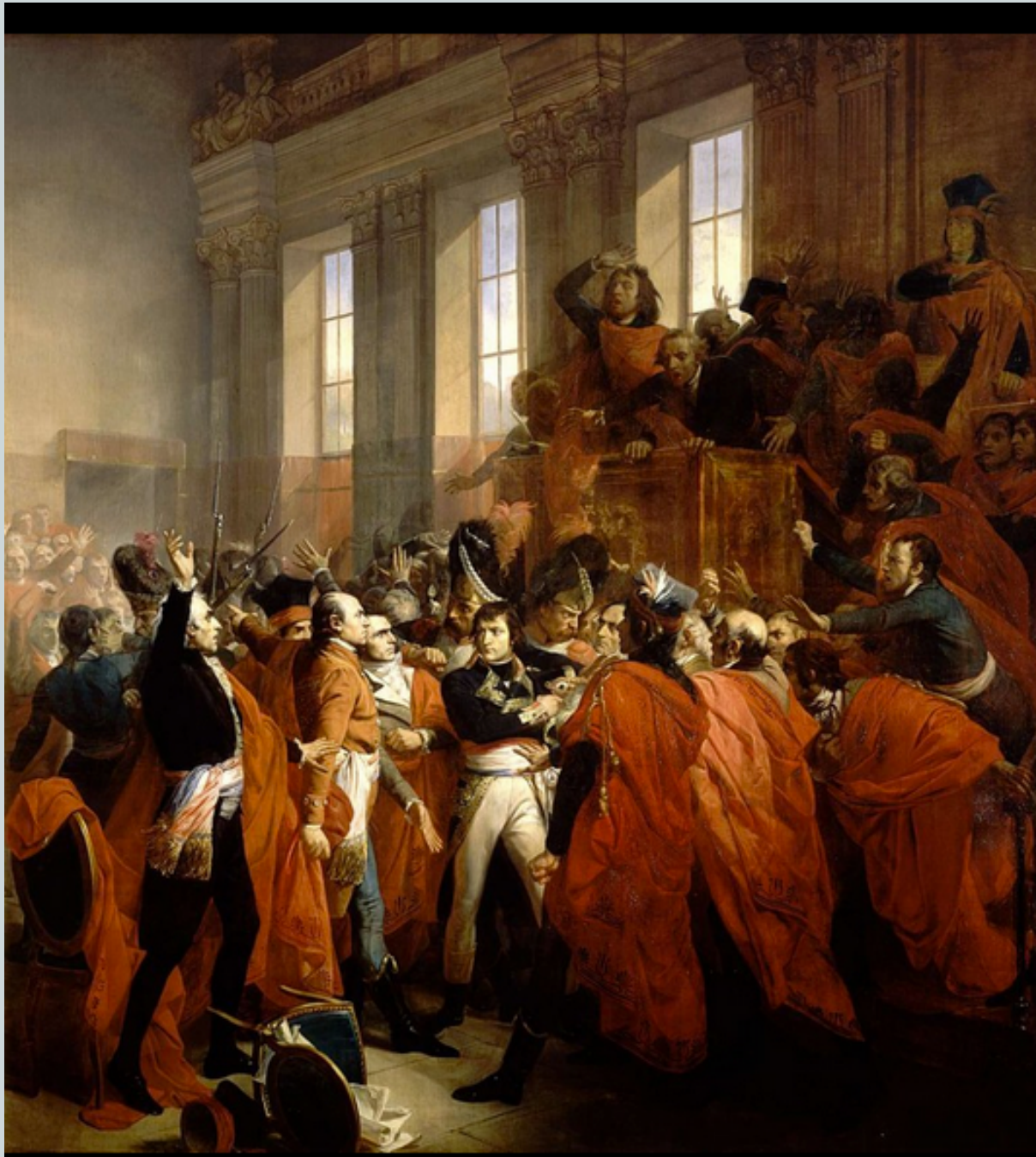
Le 18 Brumaire ( 9 novembre 1799 ) par par François Bouchot