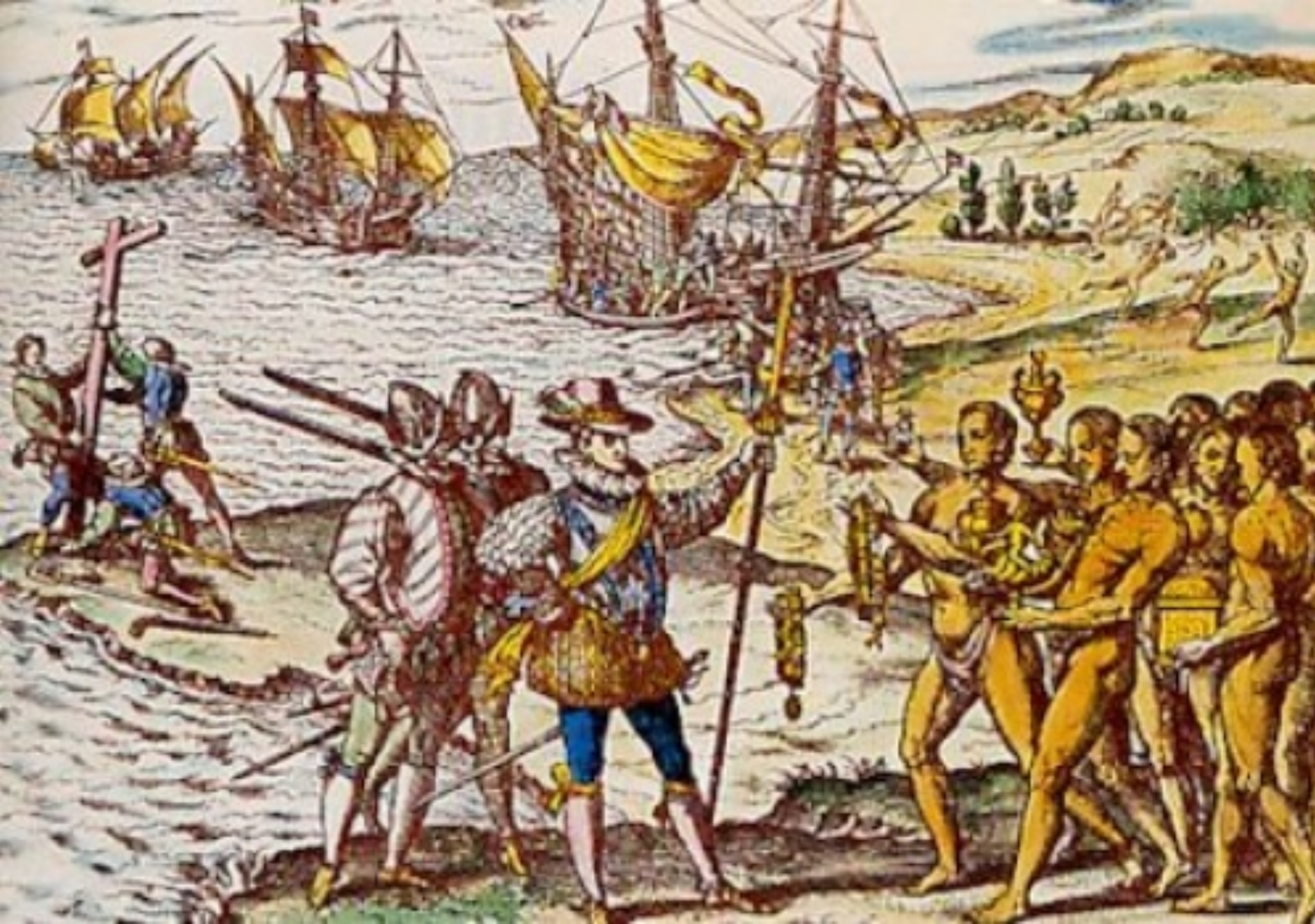
Gravure de Théodore de Bry, Grands voyages , 1594