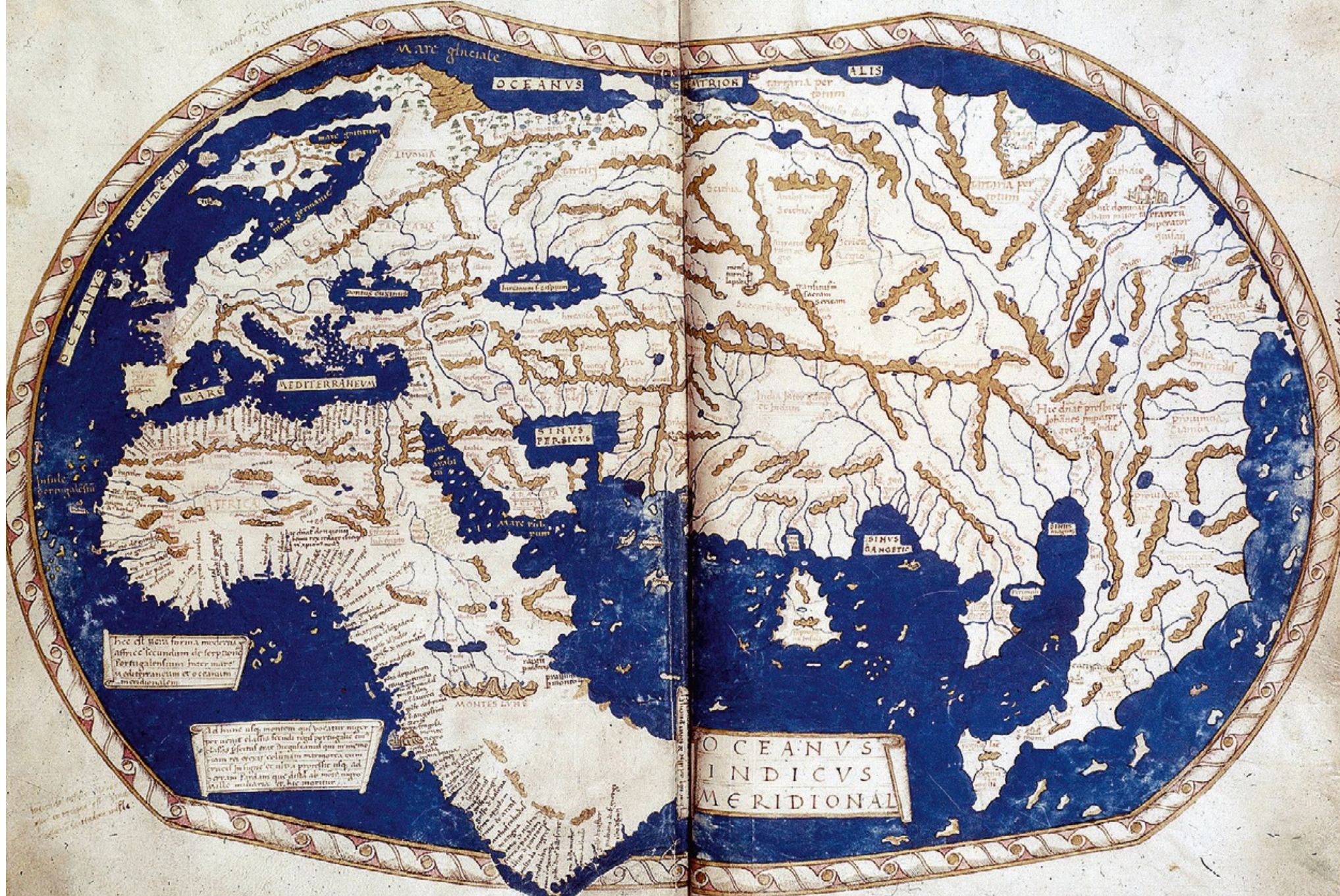
Planisphere d'Henricus Martellus, 1489, British Library, Londres