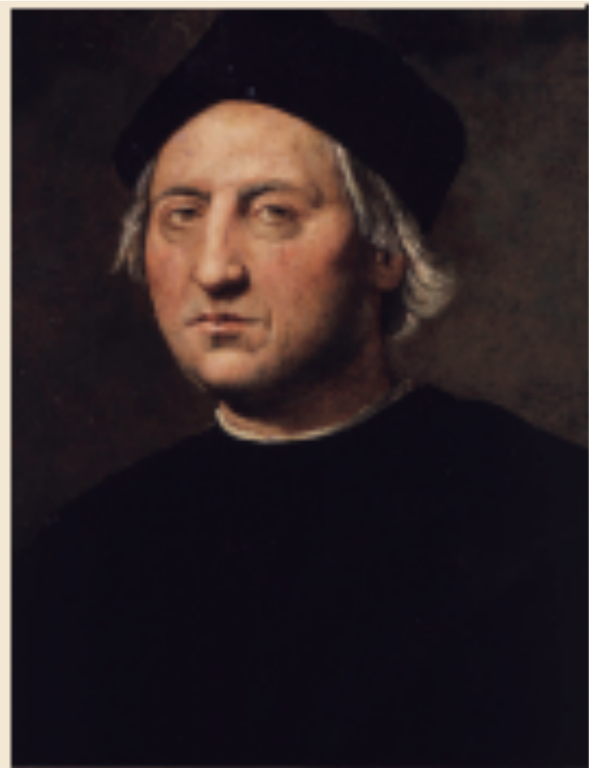
1 Christophe Colomb