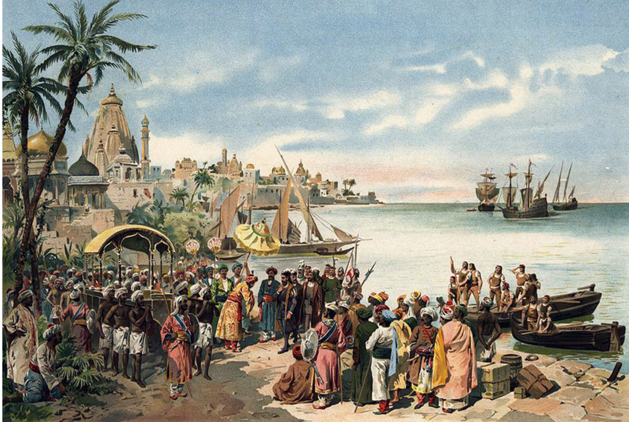
Gravure de Roque Gameiro, Arrivée de Vasco de Gama à Calicut , Bibliothèque nationale de Lisbonne, XIX e siècle