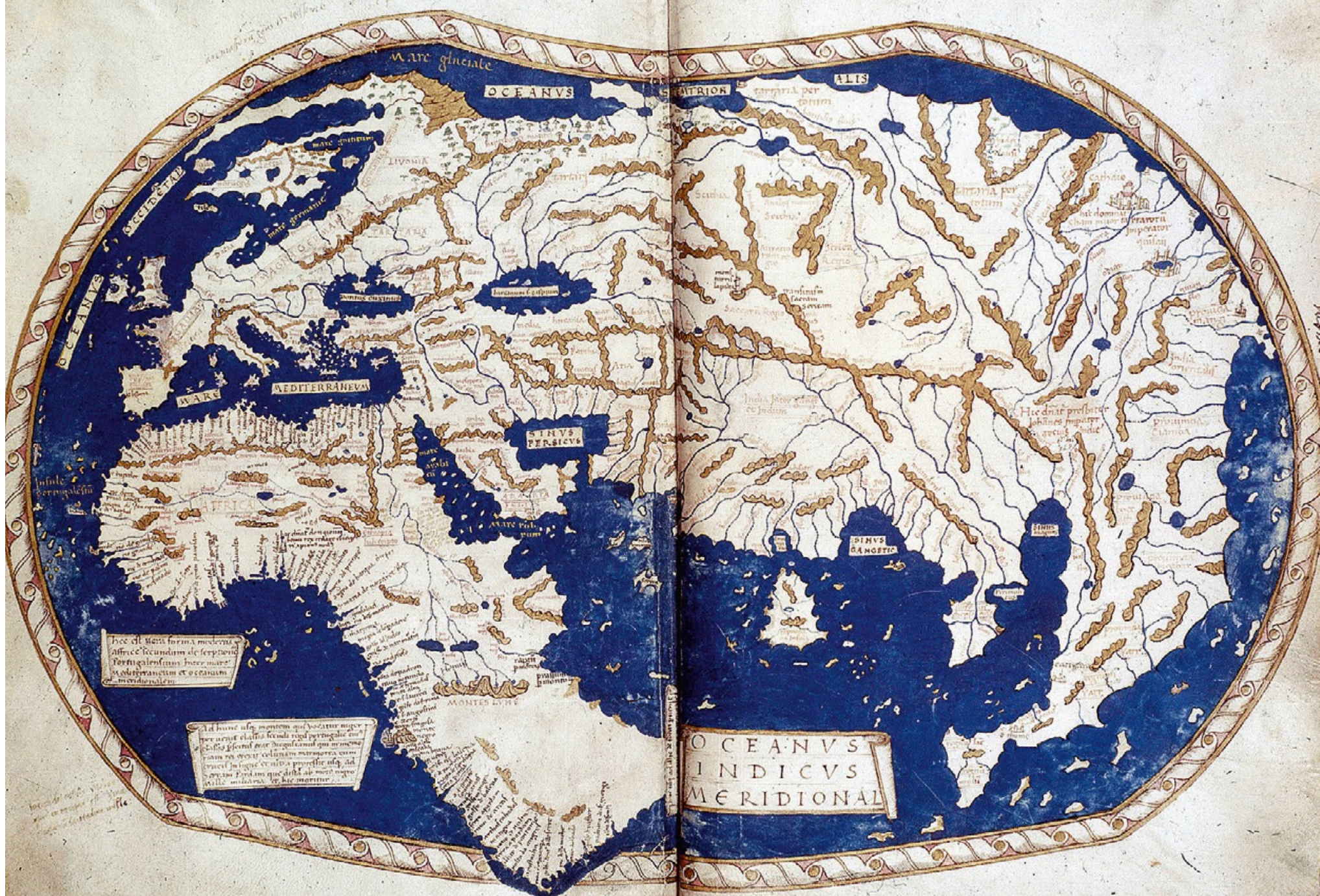
Planisphere d'Henricus Martellus, 1489, British Library, Londres