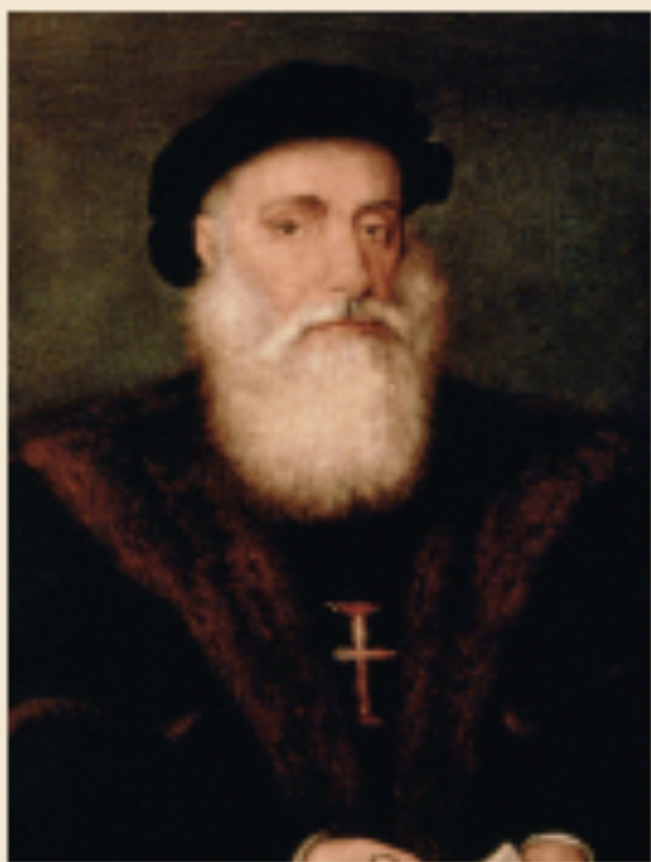
2 Vasco de Gama (1469-1524)