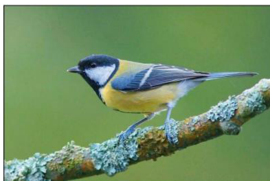
Une mésange charbonnière