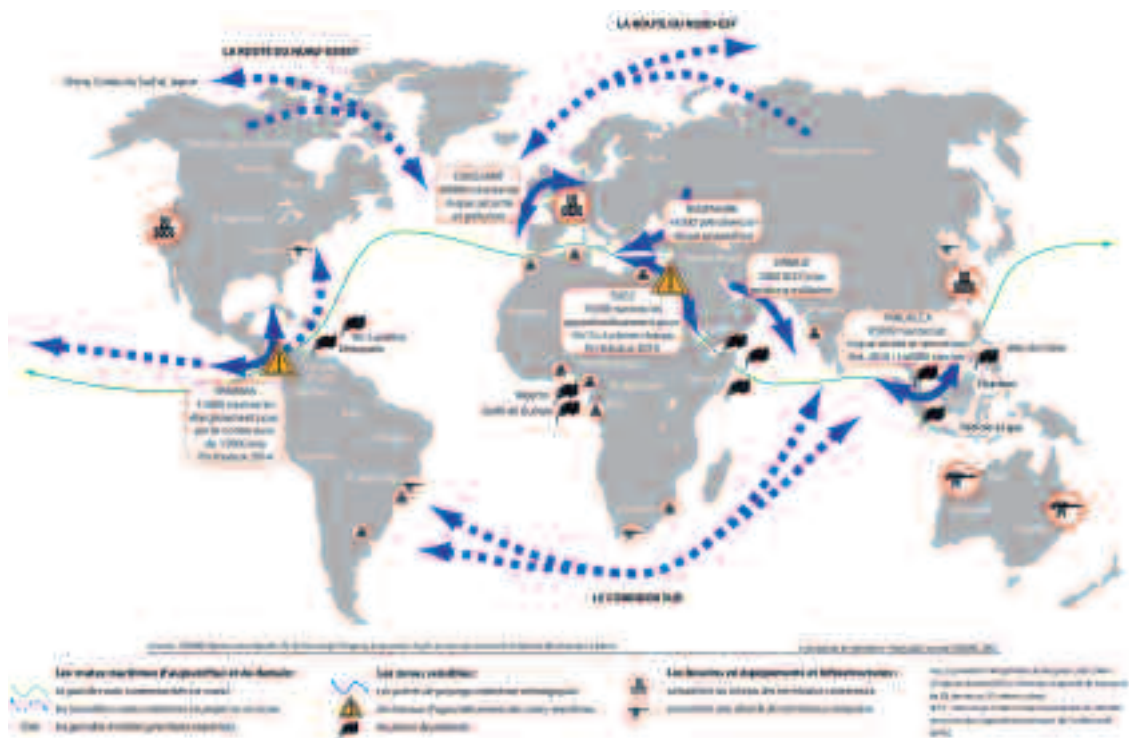
Fig. 1 – La saturation des routes maritimes mondiales