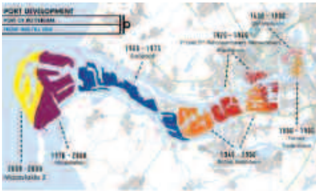
Fig. 3 – Évolution de la ZIP de Rotterdam ( http://europe.sceren.fr/index.php?id=208 )