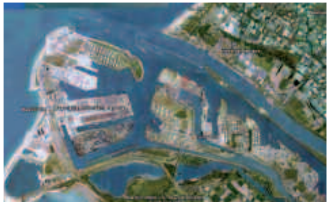
Fig. 4 – La ZIP Maasvlakte I à Rotterdam Image Google Earth

Corrigé au TNI : les zones portuaires de Shanghai et Rotterdam sont des mosaïques qui progressent vers l’aval par poldérisation, et qui se dissocient de façon inégale du port-mère : passage des ZIP d’estuaire à des hubs. La distanciation spatiale du hub de Shanghai est beaucoup plus marquée que celle des Maasvlakte de Rotterdam, qui par ailleurs conserve une fonction industrielle, liée au pétrole. Selon les potentialités de son territoire, la ville portuaire mondialisée se coupe spatialement de la zone qui traite le trafic des conteneurs. Le hub reçoit les navires-mères et alimente un ou des feeders (ports qui desservent l’intérieur des terres). Les anciennes zones industrialo-portuaires sont parfois délaissées au profit de ces nouveaux cœurs portuaires, symboles et territoires de la mondialisation. À Yang Shan, le nouveau hub est aussi la vitrine de la modernité chinoise et de sa puissance mondiale.