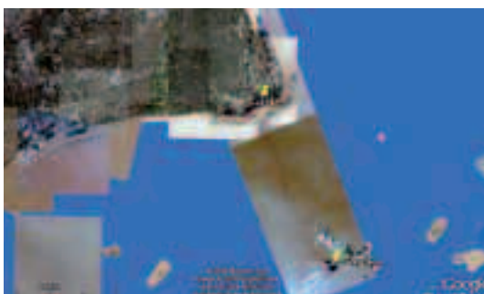
Fig. 2 – De Yang Shan à Luchao et à Shanghai : les lieux du reportage de Thalassa sont localisés sur Google Earth

et « À bord du porte-conteneurs CMA-CGM Nabucco ») et répondre aux questions : prélèvement d'informations sur les atouts de la zone portuaire de Yang Shan. Correction au TNI et ajouts : insularité, port en eaux profondes, conteneurisation du trafic de marchandises mondial, ambition mondiale de la Chine et fierté nationale, gigantisme.