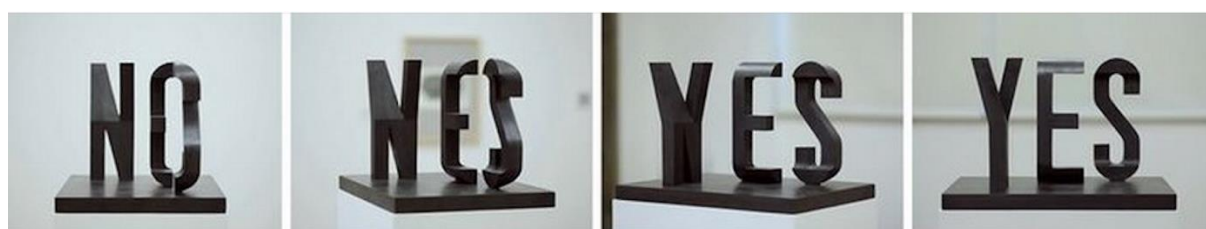
Prises de vue photographiques lors du déplacement autour de la sculpture.