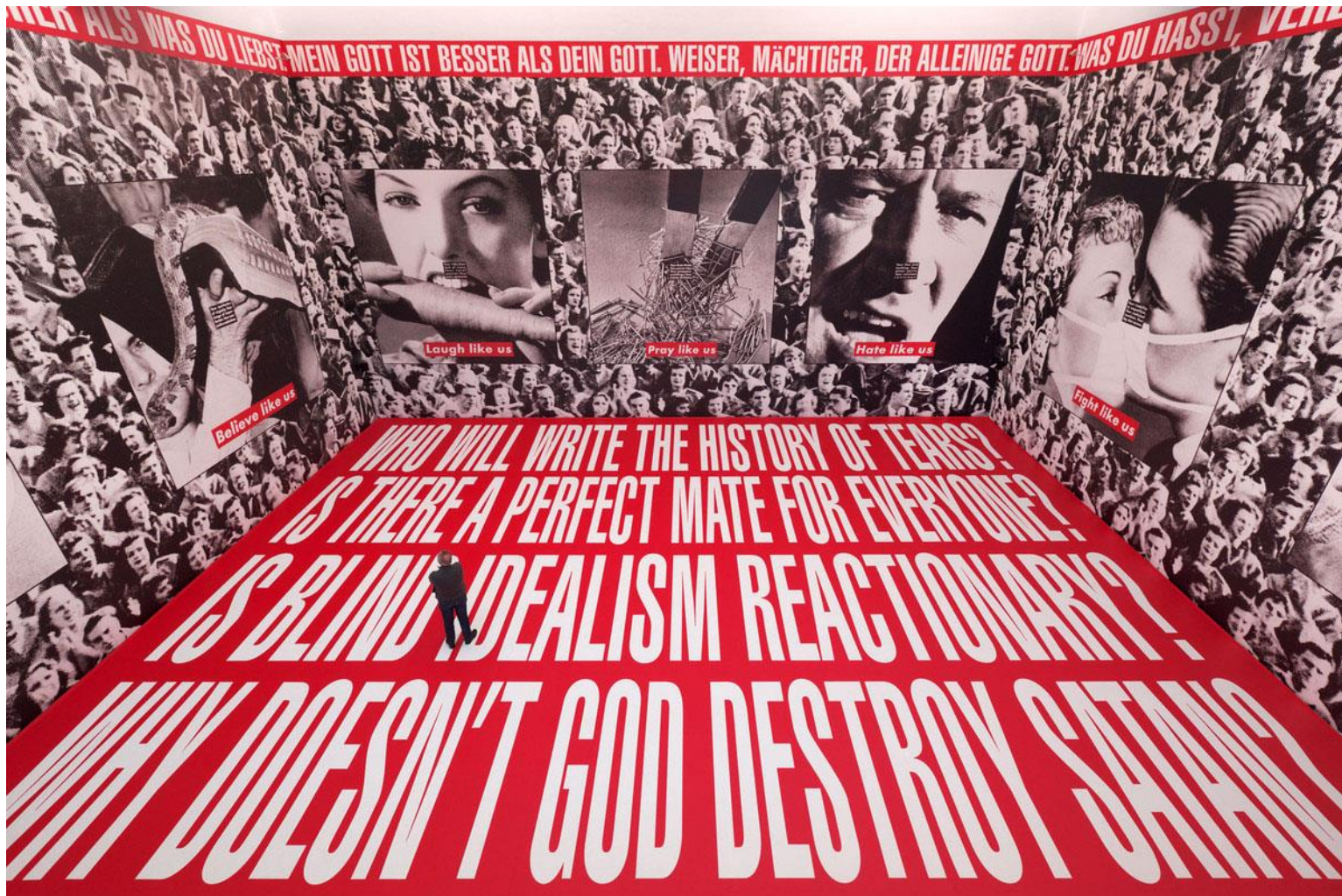
Barbara KRUGER, Untitled (Sans titre) , 1994-1995, dimensions variables, installation de sérigraphies photographiques sur papier. Museum Ludwig, collection Ludwig, Cologne, Allemagne.