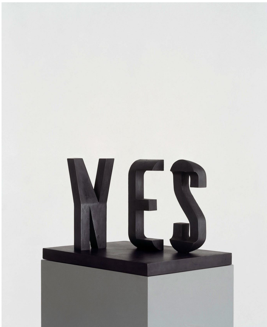
Markus RAETZ, Crossing (Traversée) , 2002, fonte de fer, 26,4 x 40,2 x 29,5 cm. Collection particulière.